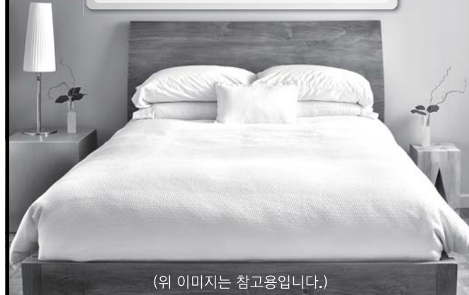
(위 이미지는 참고용입니다.)

공장 : 제주시 화북동 원두길 8 상담 : 제주시 탐동로 37 (세사리빙 제주점)