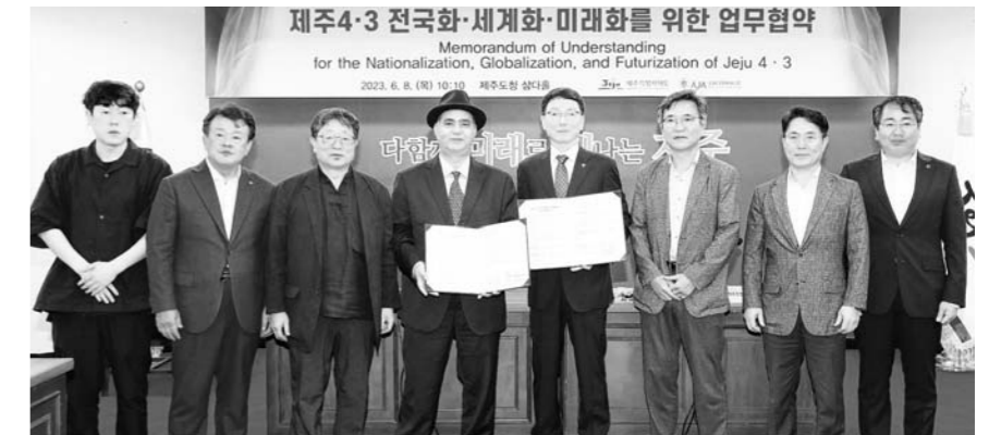
제주도는 8일 본청에서 아시아기자협회와 제주4·3의 전국화·세계화·미래화를 위한 업무협약을 체결했다.